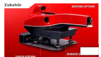
Cranfield F1 Simulator